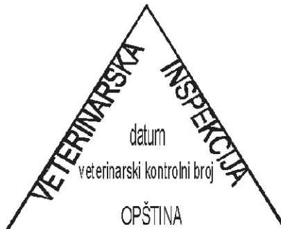
PRIMJER 8. Žig za označavanje mesa i organa neupotrebljivih za ishranu ljudi