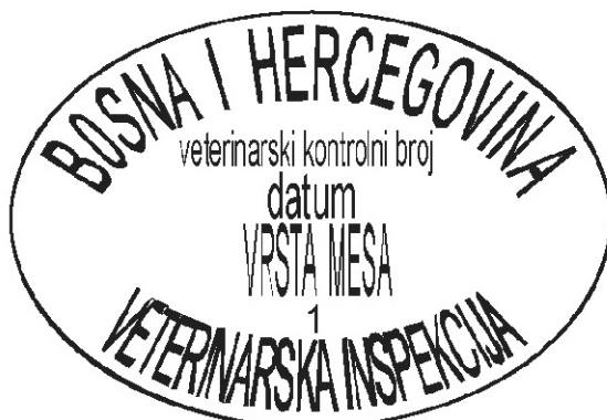
PRIMJER 3. Ovalni žig i pečat za obilježavanje mesa i organa kopitara i bivola upotrebljivih za ishranu ljudi