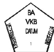
PRIMJER 10. Žig za označavanje mesa i organa sitne divljači upotrebljivih za ishranu ljudi