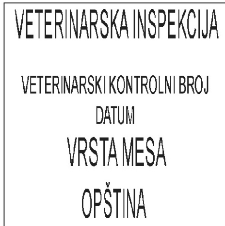
PRIMJER 6. Žig za označavanje mesa i organa uslovno upotrebljivih za ishranu ljudi