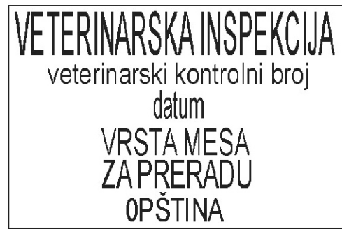
PRIMJER 7. Žig za označavanje mesa i organa upotrebljivih za preradu