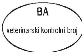
PRIMJER 11. Veterinarska oznaka za pojedinačna pakiranja sirovina, proizvoda i prehrambenih proizvoda