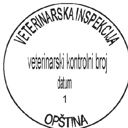
PRIMJER 2. Okrugli žig i pečat za obilježavanje mesa i organa papkara upotrebljivih za ishranu ljudi