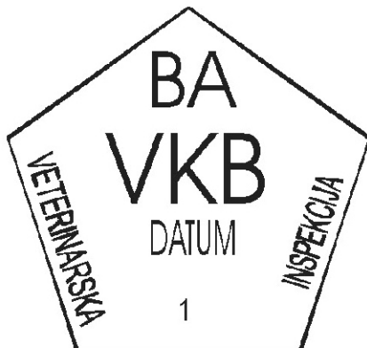
PRIMJER 9. Žig za označavanje mesa i organa krupne divljači upotrebljivih za ishranu ljudi