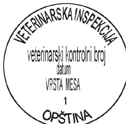
PRIMJER 4. Okrugli žig i pečat za obilježavanje mesa i organa kopitara i bivola upotrebljivih za ishranu ljudi