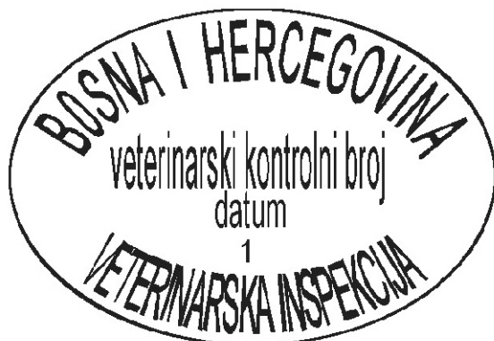
PRIMJER 1. Ovalni žig i pečat za obilježavanje mesa i organa papkara upotrebljivih za ishranu ljudi