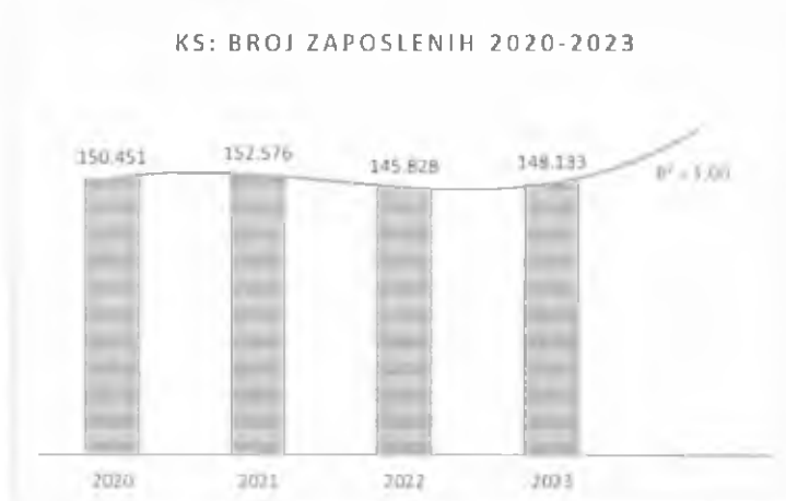
Grafikon 2. Broj zaposlenih u periodu od 2020. - 2023. godine

Broj zaposlenih u Kantonu Sarajevo se u proteklih nekoliko godina kretao oko 150.000 osoba, uz neznatan pad u 2022. godini od 4,42% u odnosu na prethodnu godinu, ali i oporavak od 1,58% zabilježen godinu dana kasnije. Iako u relativnom smislu nisu visoke, oscilacije u broju zaposlenih u periodu 2022. - 2023. godine nisu zanemarive ako se posmatraju u apsolutnom iznosu. Ipak, prognoza polinomnim trendom za narednu godinu je optimistična i predviđa dalji porast broja zaposlenih koji se svakako mora posmatrati u okvirima realnog potencijala tržišta rada u Kantonu Sarajevo.